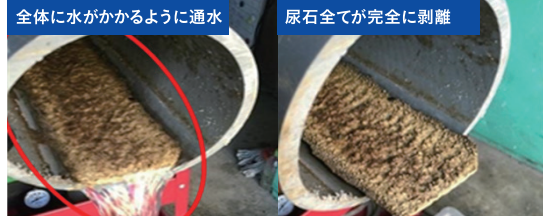
全体に水がかかるように通水 (写真左)、尿石全てが完全に剥離 (写真右)。6L/分の通水で100時間後に尿石層は、塩ビ配管下地との境目で全面が浮くように剥離。